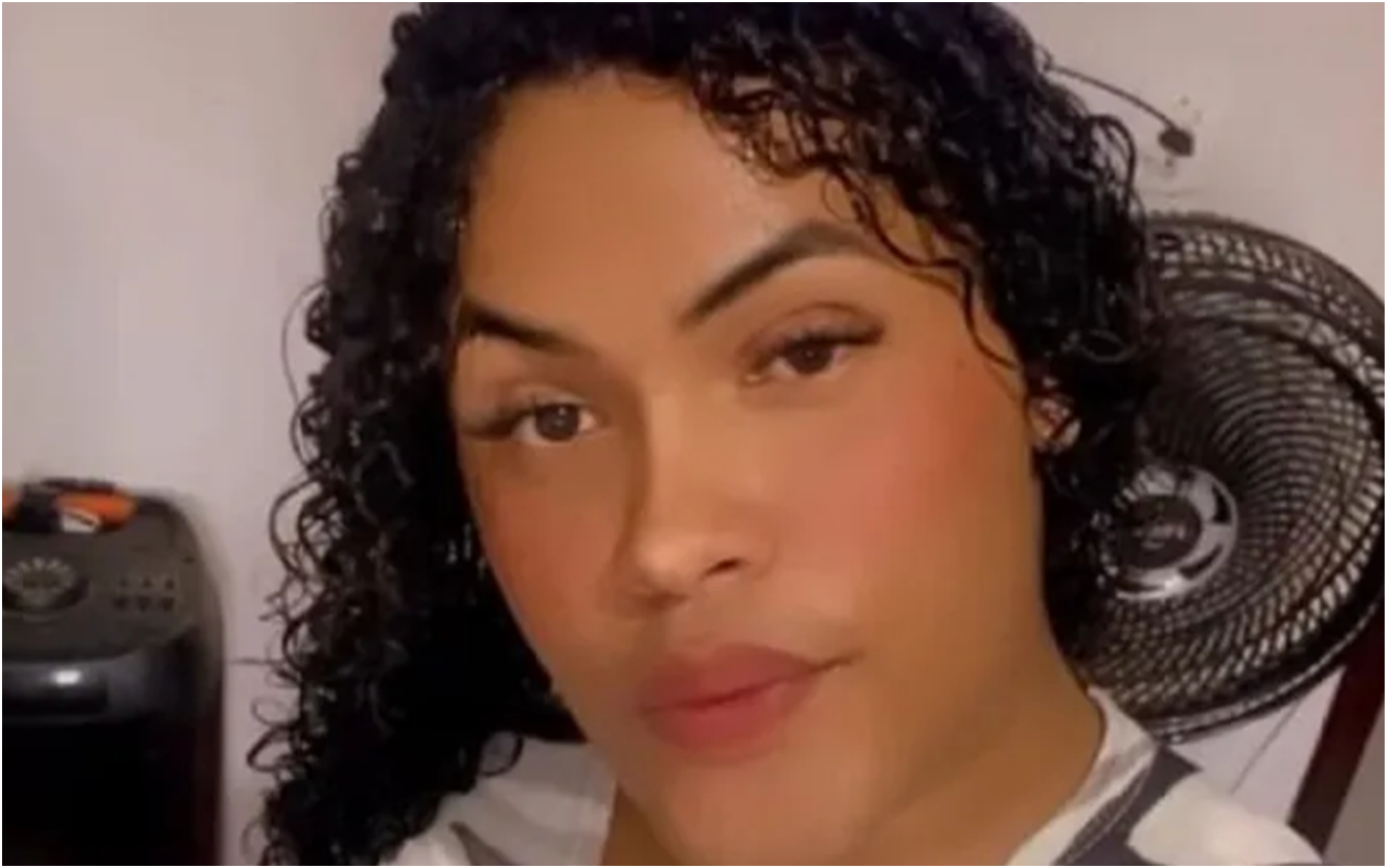
Mayla Mendes