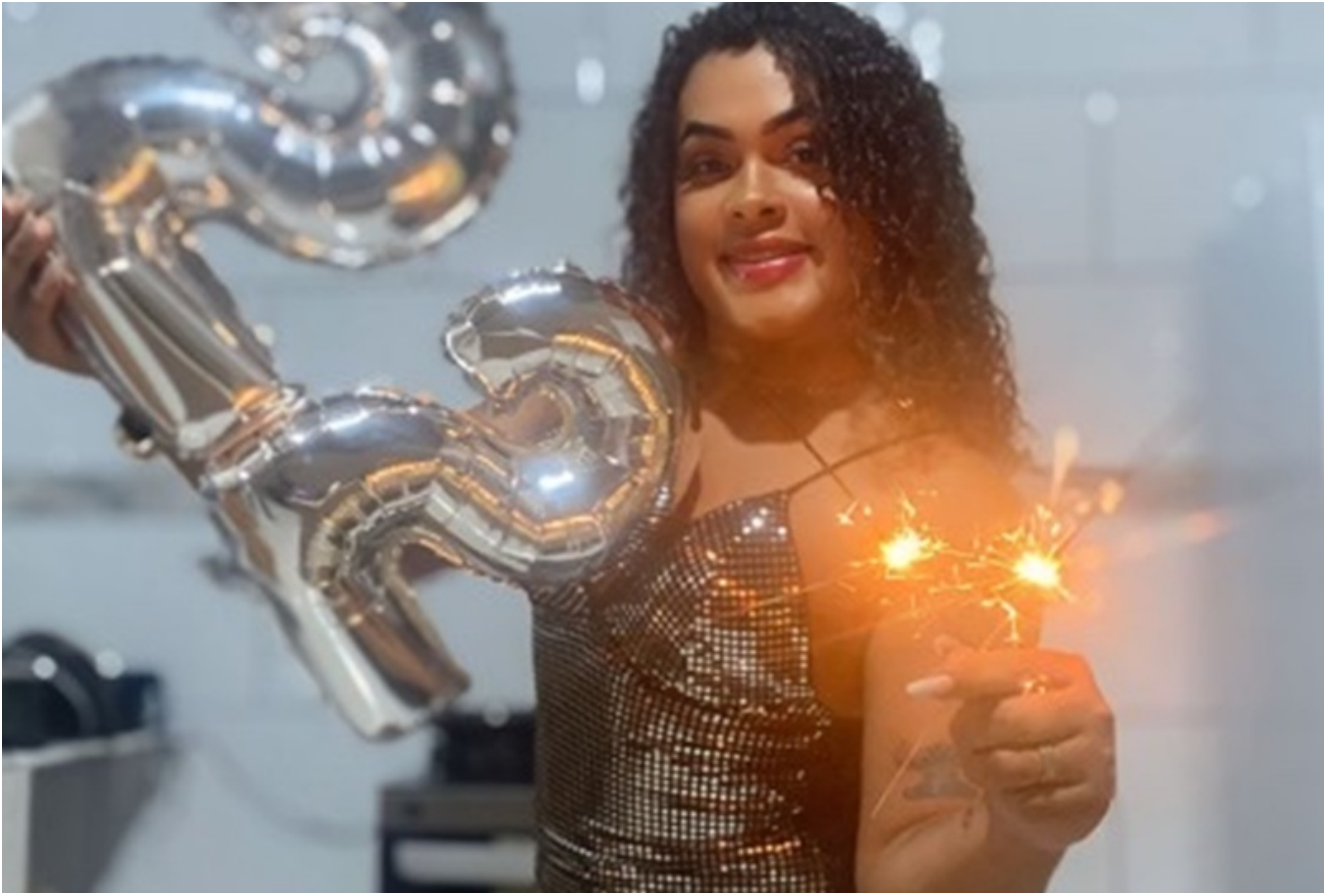
Mayla Mendes